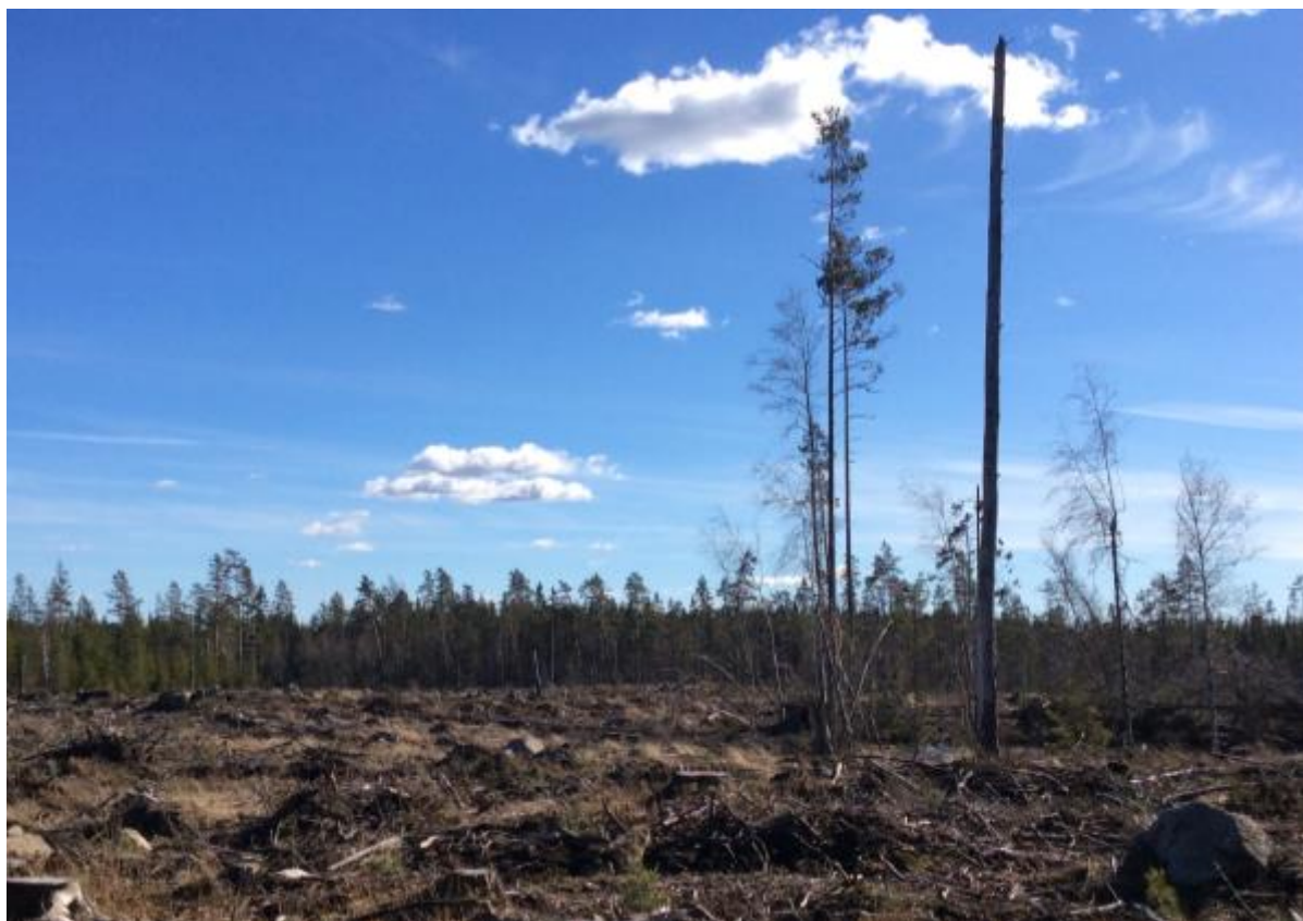
Figur 2. Foto från en av observationsplatserna nära Nymåla.