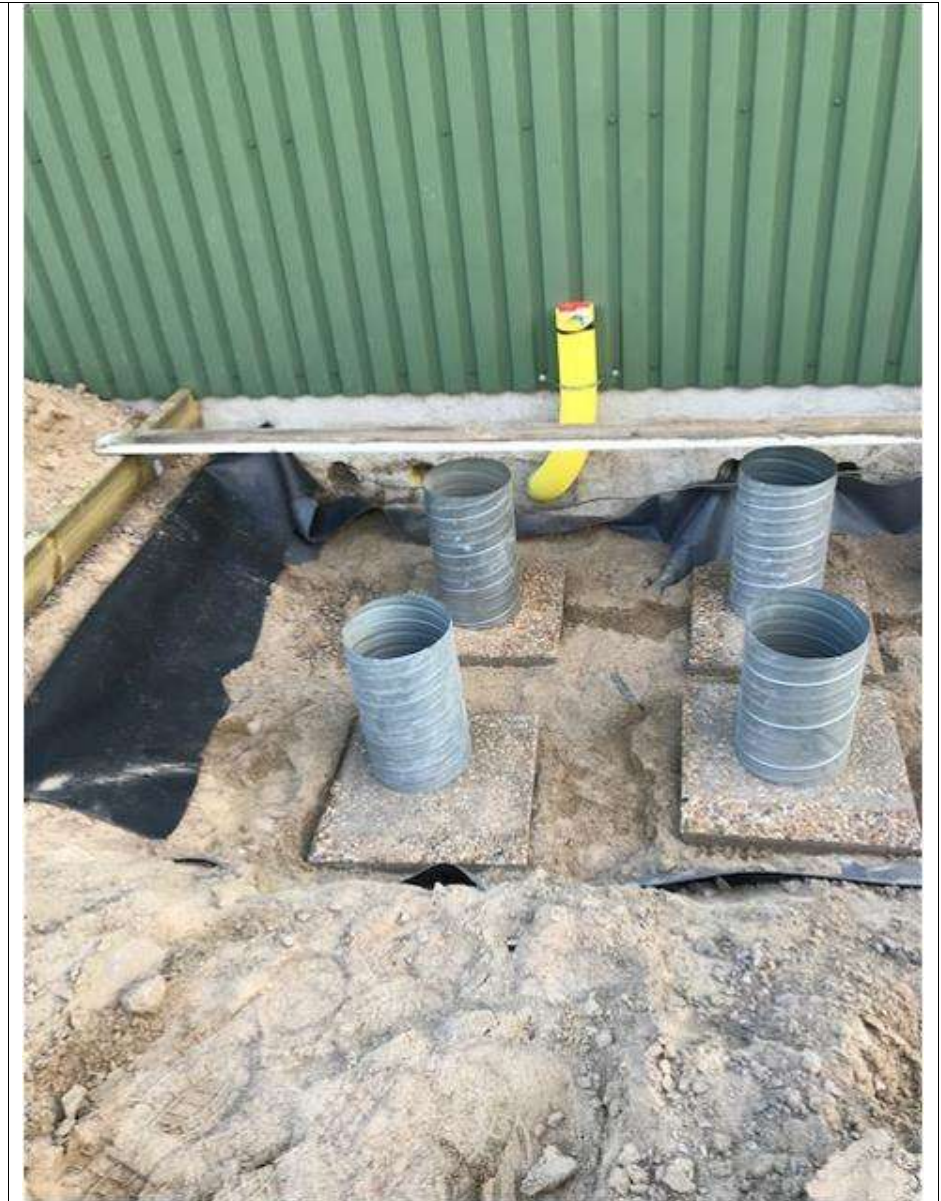
Betongplattor och pelarfundament