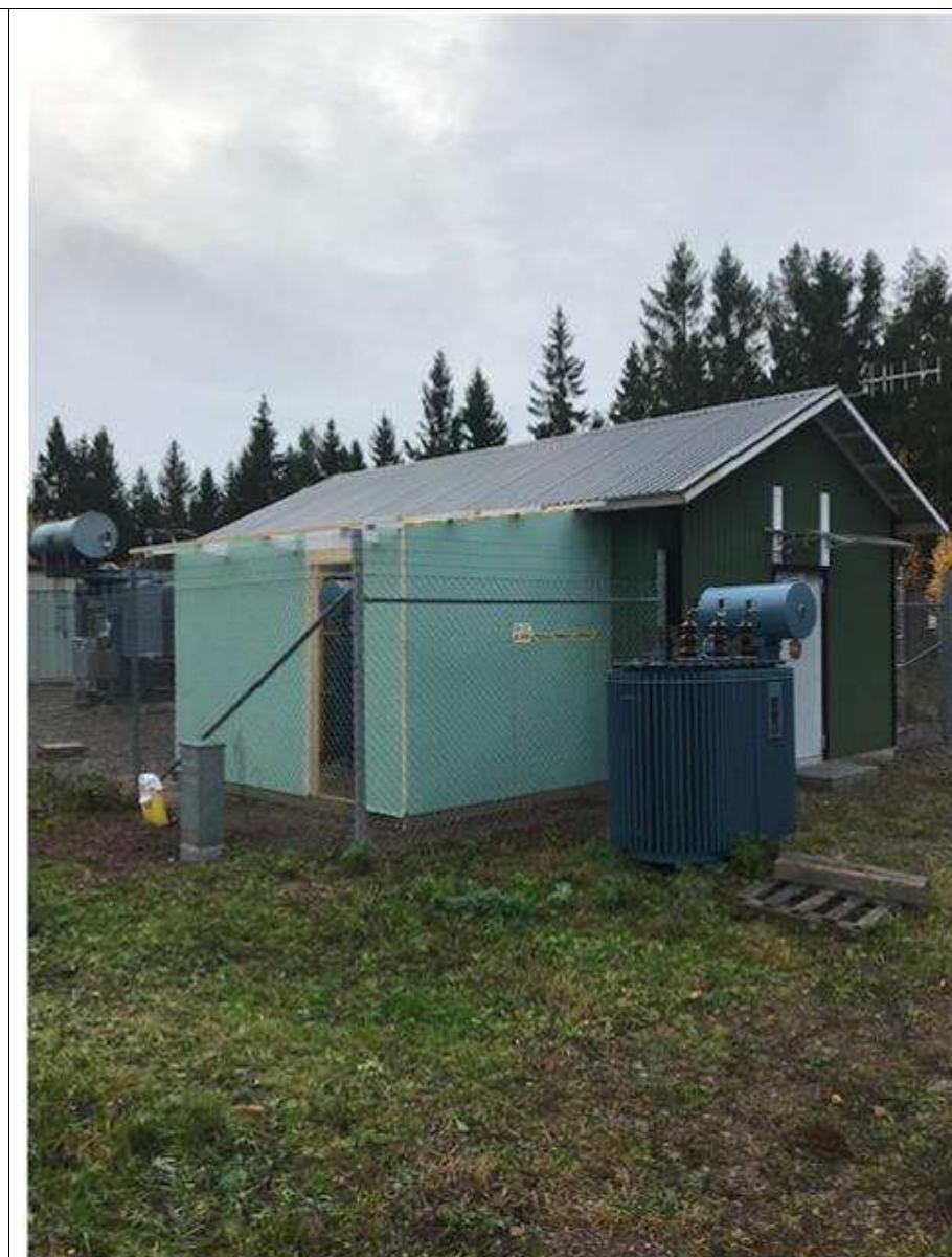
Börjar bli färdigt