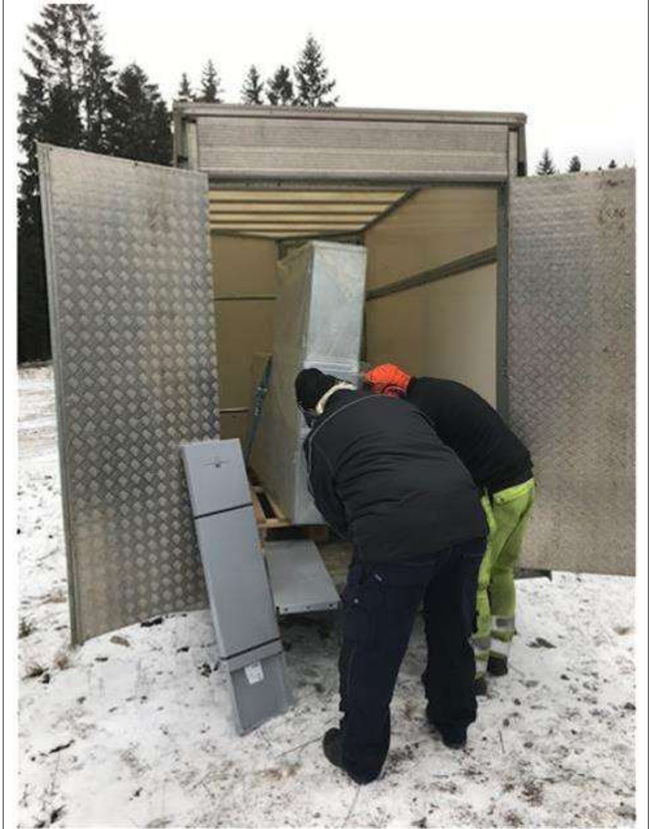
Kopplingskåp ska lyftas ut (tungt)