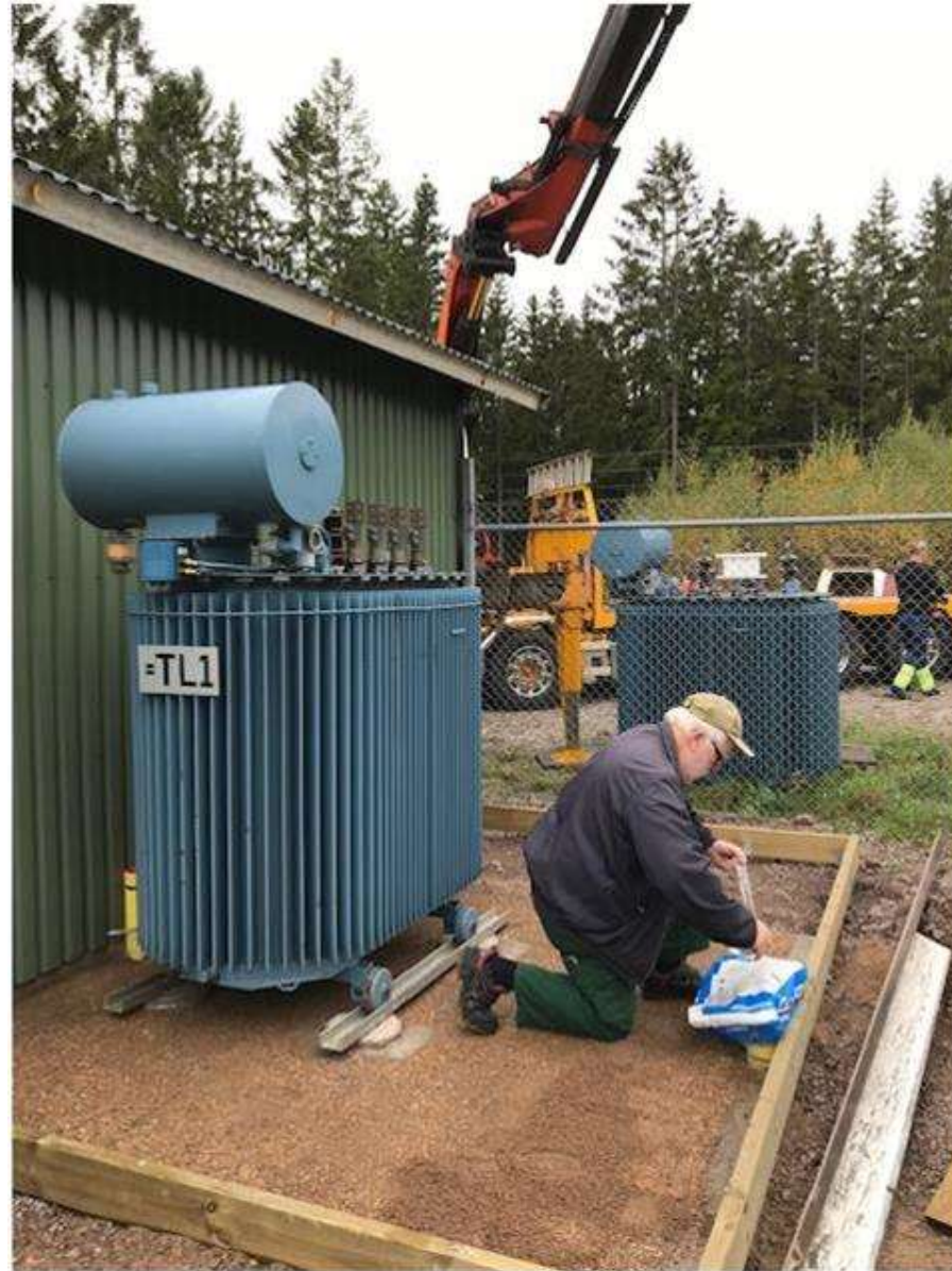
Stående syll klar för väggar