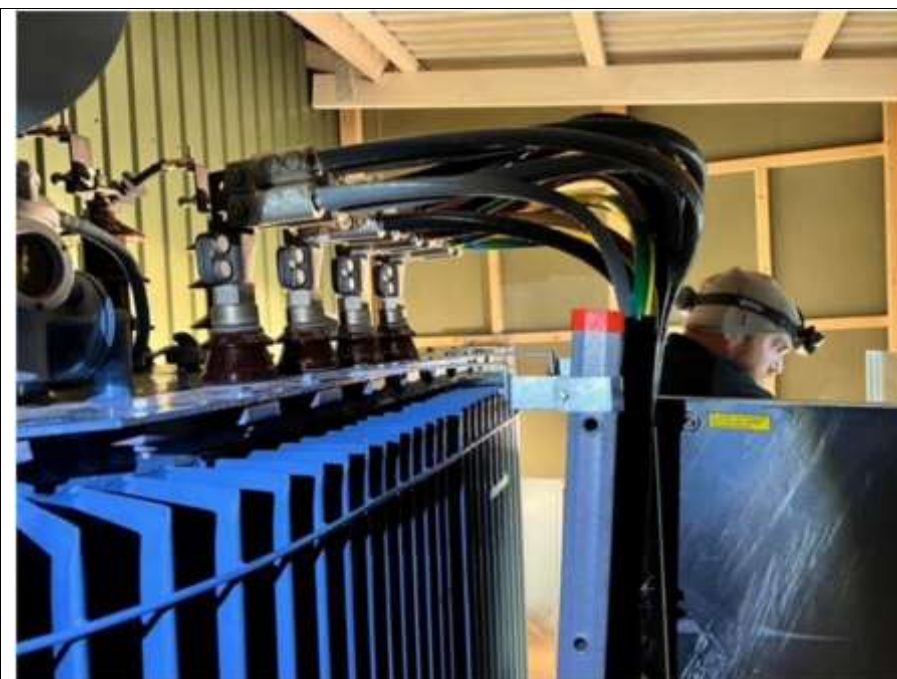
Mycket kablar och trångt