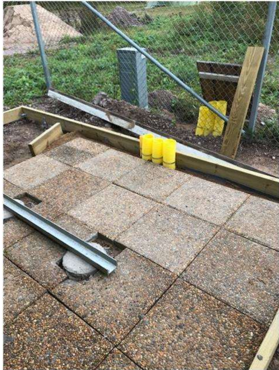
Begagnade betongplattor fick bli golv